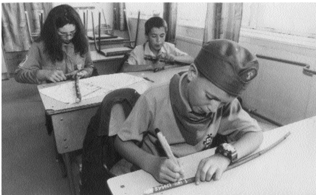
Pálcára rovó cserkészek

Egyes szakemberek kétlik, hogy valóban létezik egy külön, önálló „pálos“-féle rovásírás? Véleményük szerint erre nincs tudományos bizonyíték, a „pálos“-nak tekintett rovásírásnak nincsenek egyértelműen meghatározható, igazi csoportképző jellemzői.