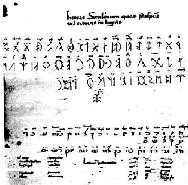
A teljes ábécé első lejegyzése 1483-ból. Nikolsburgban őrizték.

Különböző kutatók, különböző ábécét állítottak össze. Azért nem kell megijedni, szerencsére ezek nem sokban különböznek egymástól. A két legelterjedtebb változata, az ún. Magyar Adorján-féle ábécé és a Forrai Sándor-féle (ezt használjuk mi).