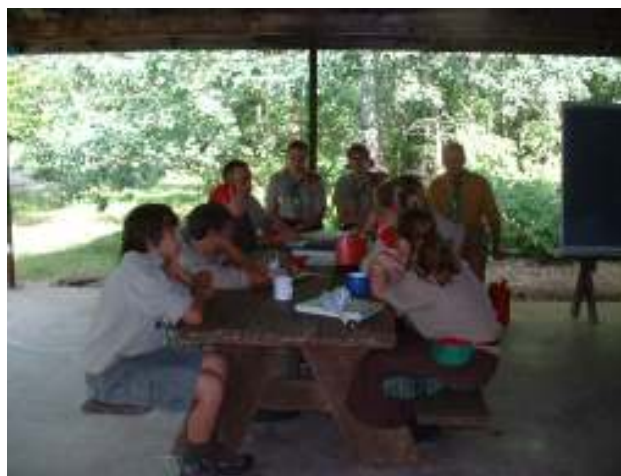
Tanácskozás az ŐV táborban, Fillmore, NY

* Az első vasárnapon a KMCsSz szeretett Ádám Atyája tartotta a Szentmisét és 4