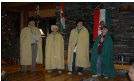
Calgary betlehemes játék

abban, hogy a következő családi estig nem fogunk 100 évet várni hanem még jövő évben megünnepeljük a Világcserkészet – akkor már 101. – évfordulóját.