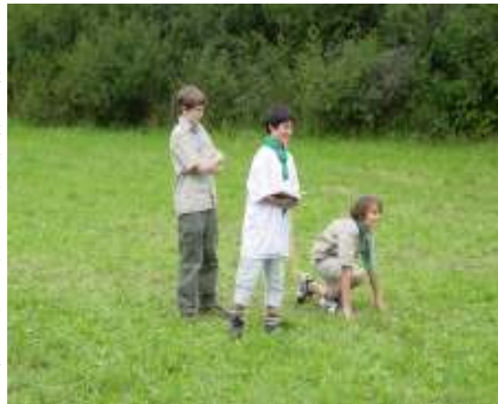
Mintatábor játék közben

napon át más lelki gondozási munkát is végzett. Ádám Atya több mint 40 éven át szolgált a KMCsSz-ben mint lelkipásztor és vezető. Az utolsó vasárnapra