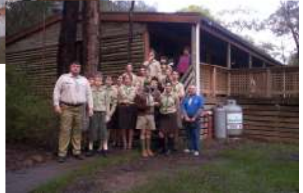
Képek az ausztrál regöstáborról