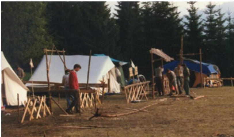
Készül az őrsvezetői tábor

A segédtsíztjelöltek képzéséhez hasonló felvételi követelményeket küldtünk át, ehhez kapcsolódtak az írásbeli vizsgák, rajprogram, őrsvezetők fel- és előkészítésével foglalkozó témák, és a portya előkészítése.