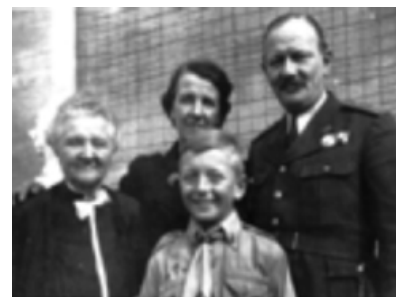
Családdal fogadalomtétel után, 1943

Cserkész lettem. Két évvel később, 1940 őszén végre cserkész lehettem, és 1943 nyarán megélhettem az első cserkészta-